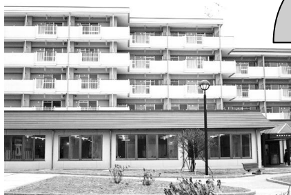
平成9年開所当時の建物外観 周囲の緑や庭園がありませんでした。

地域ケアプラザは、地域福祉の活動拠点として、誰もが住み慣れた地域で暮らしていきたいという願いに応え、職員一同、地域に開かれた運営を行いつつ、質の高いサービスの提供に努めてまいりました。